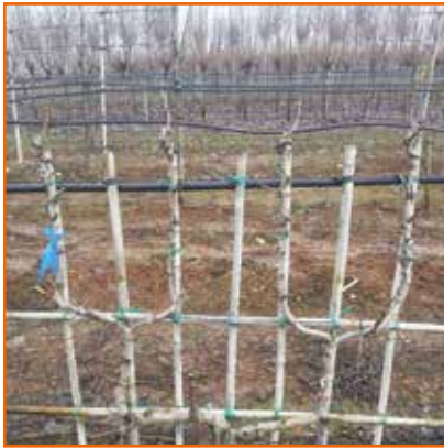
PIANTE DOPPIE U: Piante idonee per terrazzi, balconi o piccoli giardini.